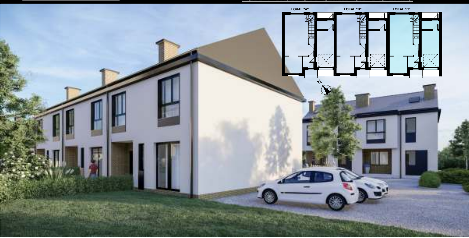
LOKALIZACJA LOKALU NA RZUCIE BUDYNKU